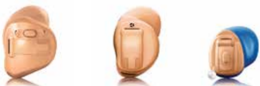
Vista DX W 312 Dir Mit Direktanbindung und traditioneller Batterie