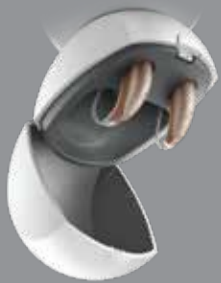
Vista DX P Li Charger