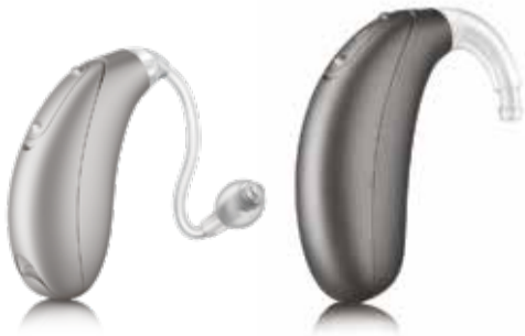
Vista DX M 312 Traditionelle Batterie

Hinter-dem-Ohr (HdO) Hörgeräte mit Direktanbindung