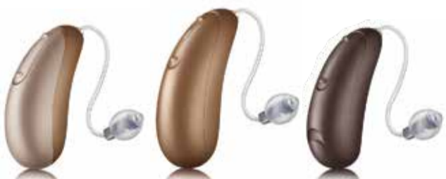
Vista DX R Li Lithium-Ionen-Akku

Receiver-in-Canal (RIC) Hörgeräte mit Direktanbindung