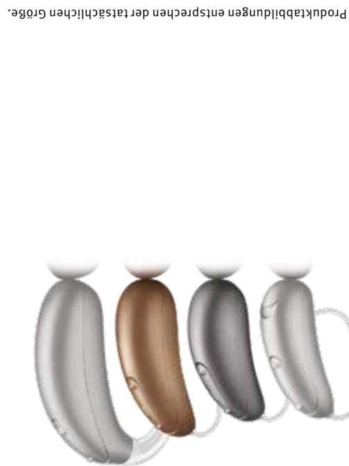
Produktabbildungen entsprechen der tatsächlichen Größe.

Mit unserer neuen Hörgeräte-Familie können Sie wieder in den schwierigsten Hörsituationen an Gesprächen teilnehmen. Darüber hinaus passen Ihre Hörgeräte perfekt in Ihre digitale Welt und können sich direkt mit Ihren bevorzugten Technologien und Medien verbinden. Mit unseren Akku-Lösungen erleben Sie den ganzen Tag uneingeschränkten Hörgenuss – vom Sonnenaufgang bis zum Sonnenuntergang.