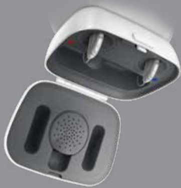
Vista DX RIC Charger

Unsere Akku-Lösungen bieten dank bewährter Lithium-Ionen-Technologie, auf die Sie sich verlassen können, den ganzen Tag uneingeschränkten Hörgenuss (einschließlich Streaming). Außerdem lassen sie sich schnell aufladen und schalten sich automatisch ein und aus, wenn sie aus der Ladeschale entfernt oder in die Ladeschale eingesetzt werden.